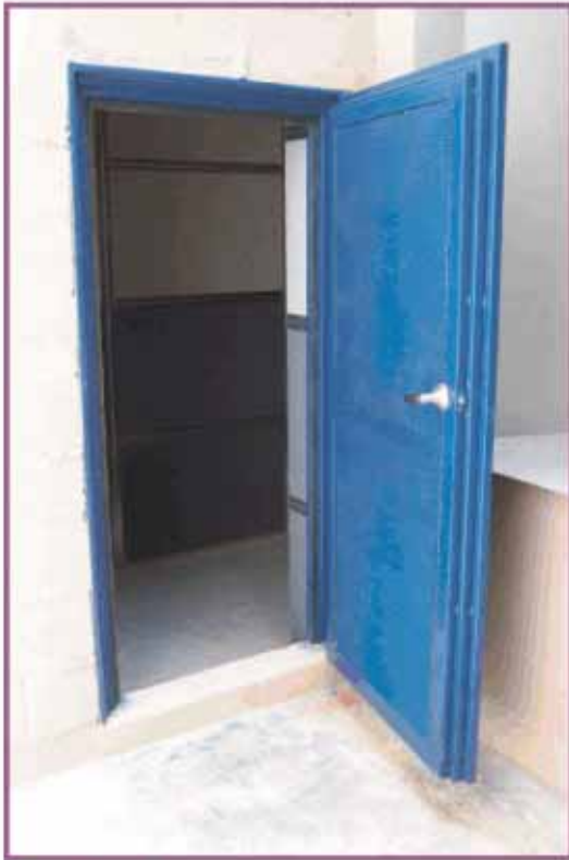
Puerta acústica con núcleo de aislamiento en lana mineral de roca.