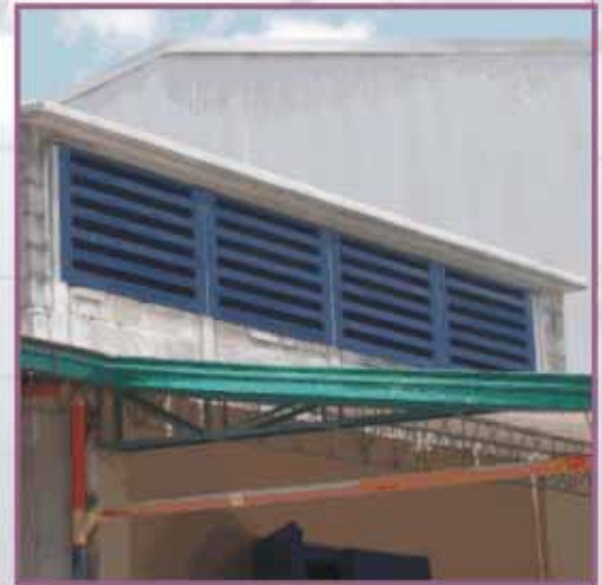
Rejillas de ventilación con trampa acústica.

Ventilación mecánica: Para evitar la transmisión de ruido al exterior en la evacuación de los gases generados en la operación de la planta con el sistema de ventilación se diseñó e instaló el silenciador de sección rectangular en lámina metálica, con deflectores en paneles doblados tipo bandeja en lámina perforada con núcleo en placas 6lb/pie 3 de densidad en lana mineral de roca. El cálculo del silenciador garantiza el control de ruido permitiendo la circulación de aire necesaria para el funcionamiento del equipo.