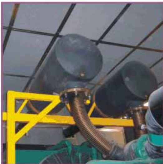
Silenciador del sistema de extracción de aire.

Aislamiento: Para evitar la transferencia de energía (ruido y calor) y reforzar el aislamiento aportado a las paredes de mampostería, se instalaron placas de yeso de 1/2" montado en estructuras independientes, con materiales aislantes en diferentes densidades entre placas y mantas de lana mineral de roca CALORCOL S.A.